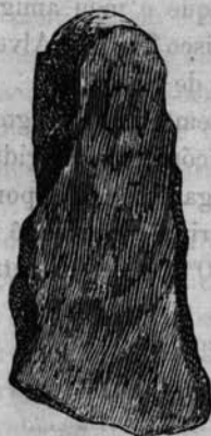
Fig. 2 (1/2)

Na fig. 4 representa-se em tamanho natural uma loba, de bronze, encontrada no ponto onde o concelho de Alcobaca confina com o das Caldas-da-Rainha. Como o lado opposto ao que se figura está mal