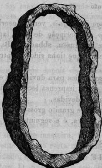
Fig. 1 (1/2)

Na fig. 3 representa-se uma chave de ferro, que parece pertencer à classe das claves Laconicae .