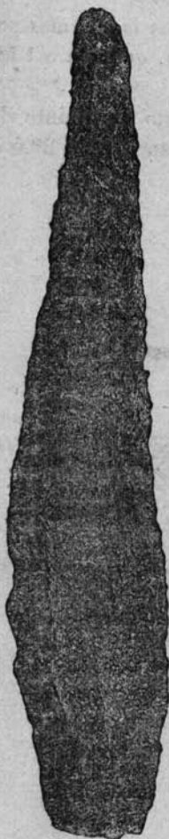
Fig. 3. a

1.º) Varios fragmentos ceramicos lisos e de pasta analoga á dos da Cunha Baixa. Appareceram na camara, á profundidade de 0 m ,44. Outro fragmento, mas ornamentado, como se vê na fig. 2. a , appareceu á entrada da galeria.