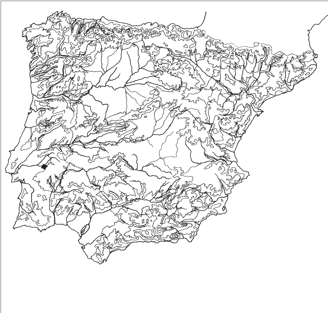
FIG. 1 – Localização da área de Pavia na Península Ibérica.