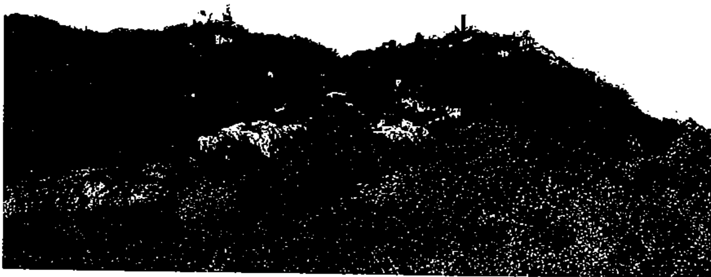
10001 - São Pedro de Canaferrim na serra de Sintra, tirado de Leste.