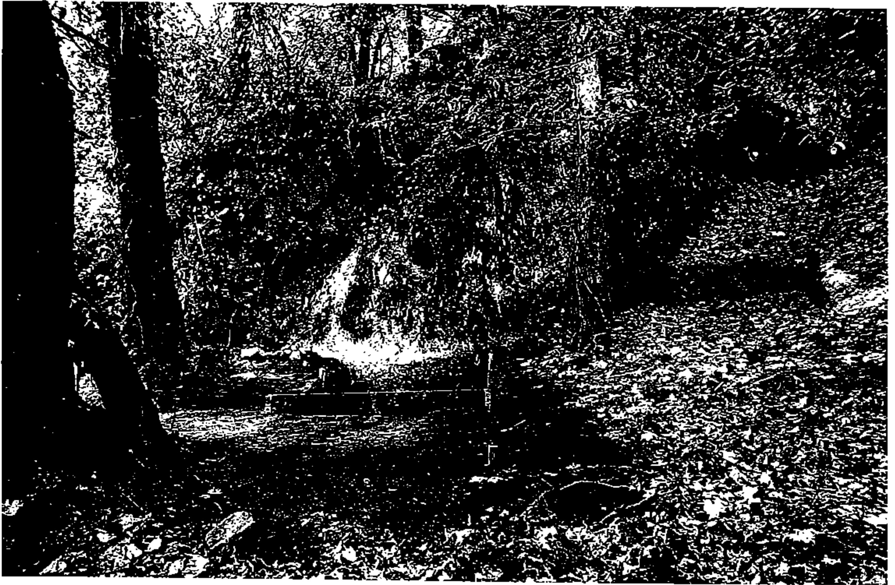
foto 1 - O locus 2 de São Pedro de Canaferrim no início da 2ª campanha de escavações realizada no sítio (Novembro de 1993).