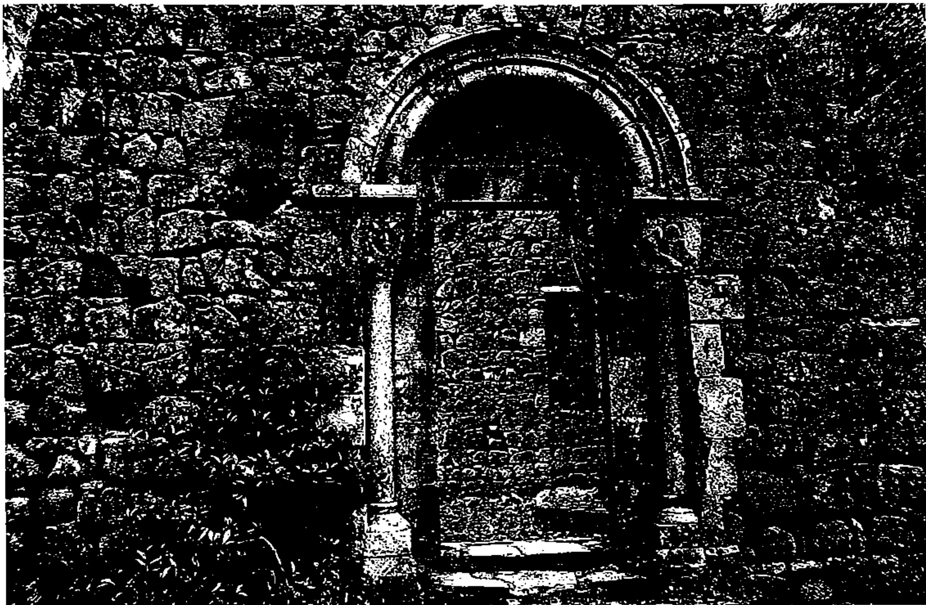
foto 1 – Ruínas da Igreja românica no locus 1 de São Pedro de Canaferrim.