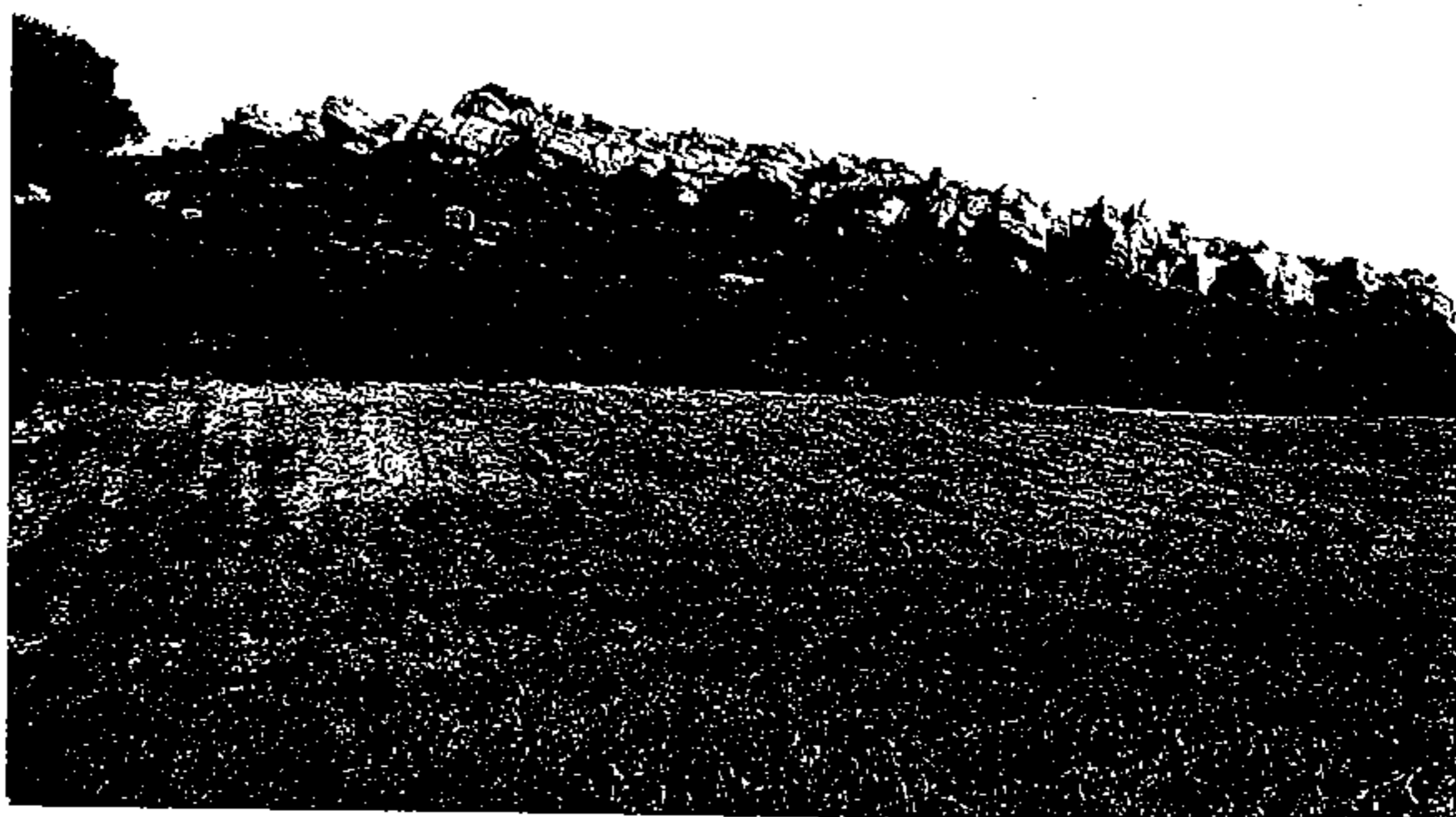
foto 5 - Penedo da Cortegaça, tirado de Oeste.