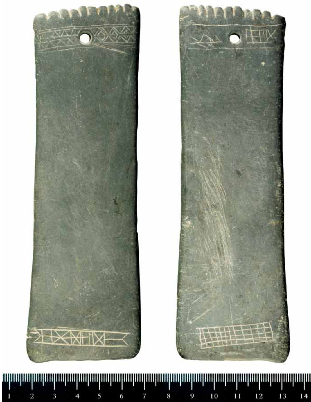
Figs. 4-5 As duas faces da placa de xisto gravada da Alcáçova de Santarém (foto VSG, tal como as seguintes).