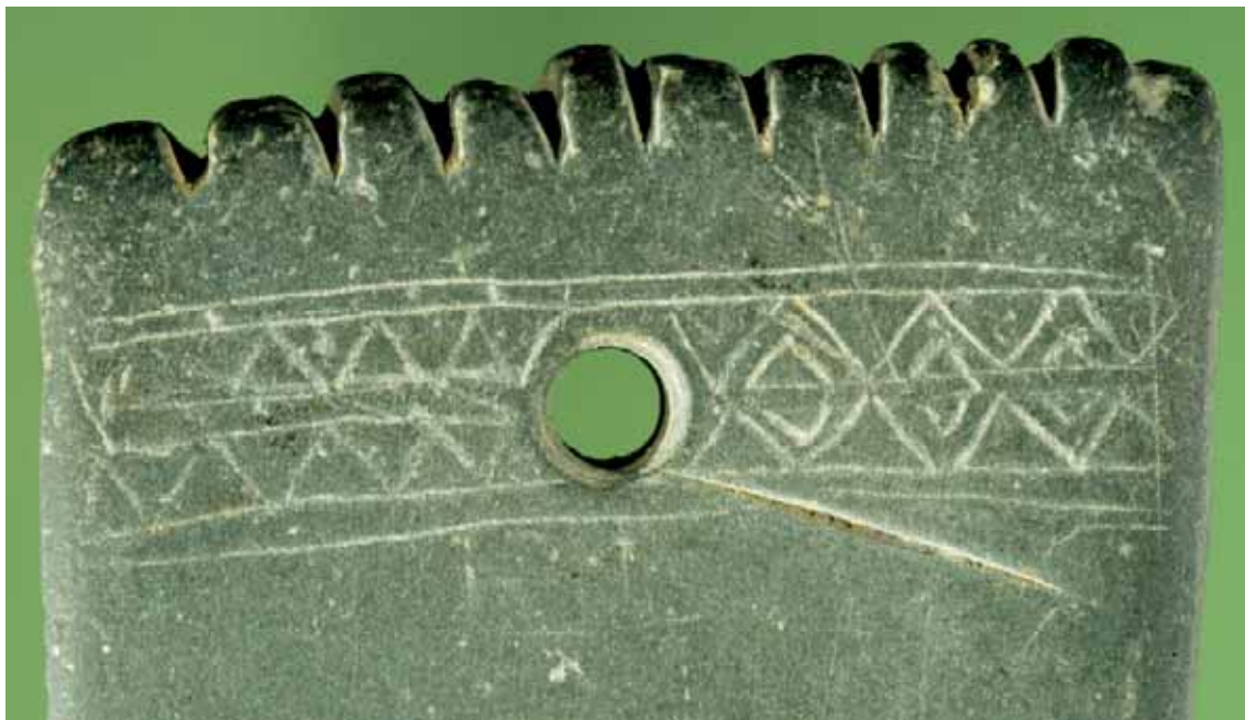
Fig. 6 Detalhe do topo da face A da placa de xisto gravada.