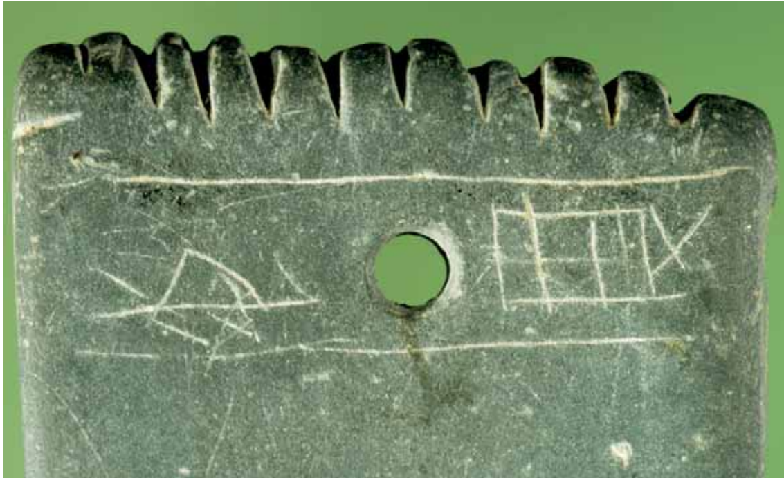
Fig. 8 Detalhe do topo da face B da placa de xisto gravada.