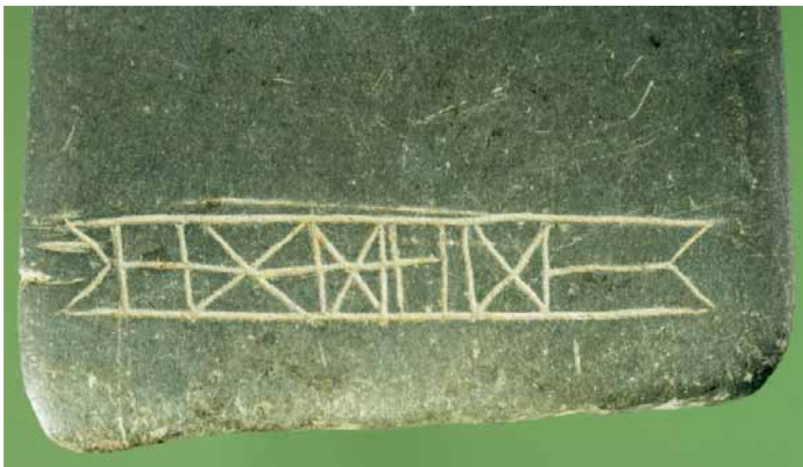
Fig. 7 Detalhe da base da face A da placa de xisto gravada.