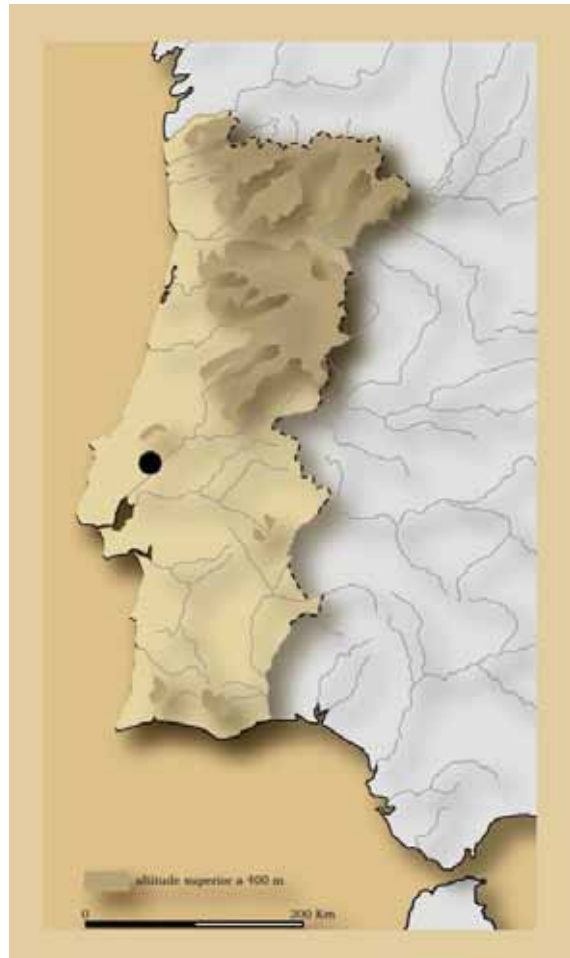
Fig. 1 A localização de Santarém no território hoje português.

Não tenho muito para publicar, nesta perspectiva, mas não vejo porque tardar a fazê-lo.