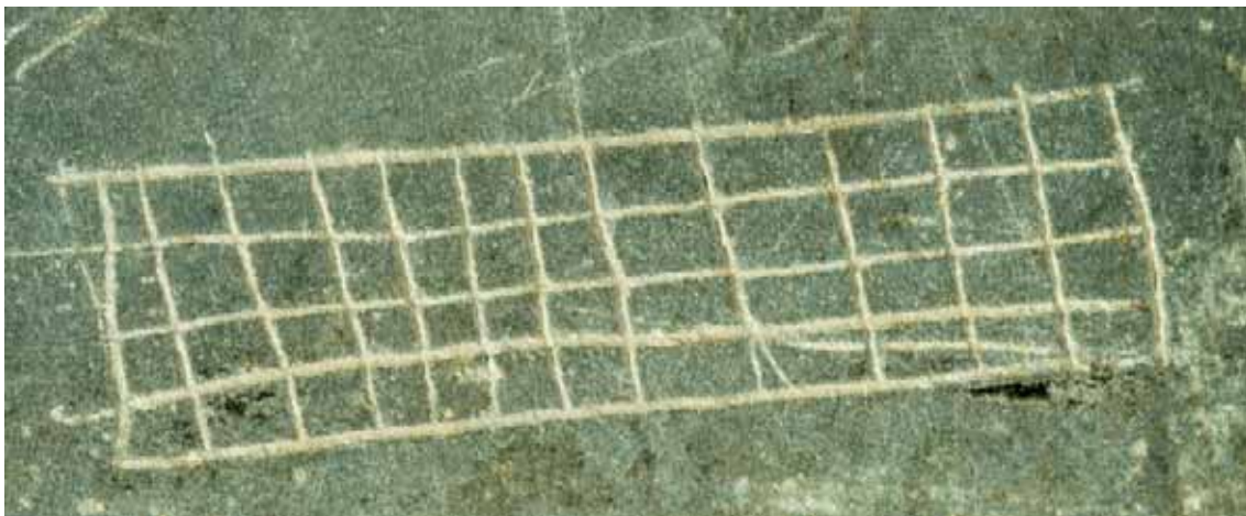
Fig. 9 Motivo da base da face B da placa de xisto gravada.

A meio da placa, área com riscos finos, oblíquos, resultantes com toda a probabilidade de fenómenos pós-depositivos, que nada tem que ver com a placa original.