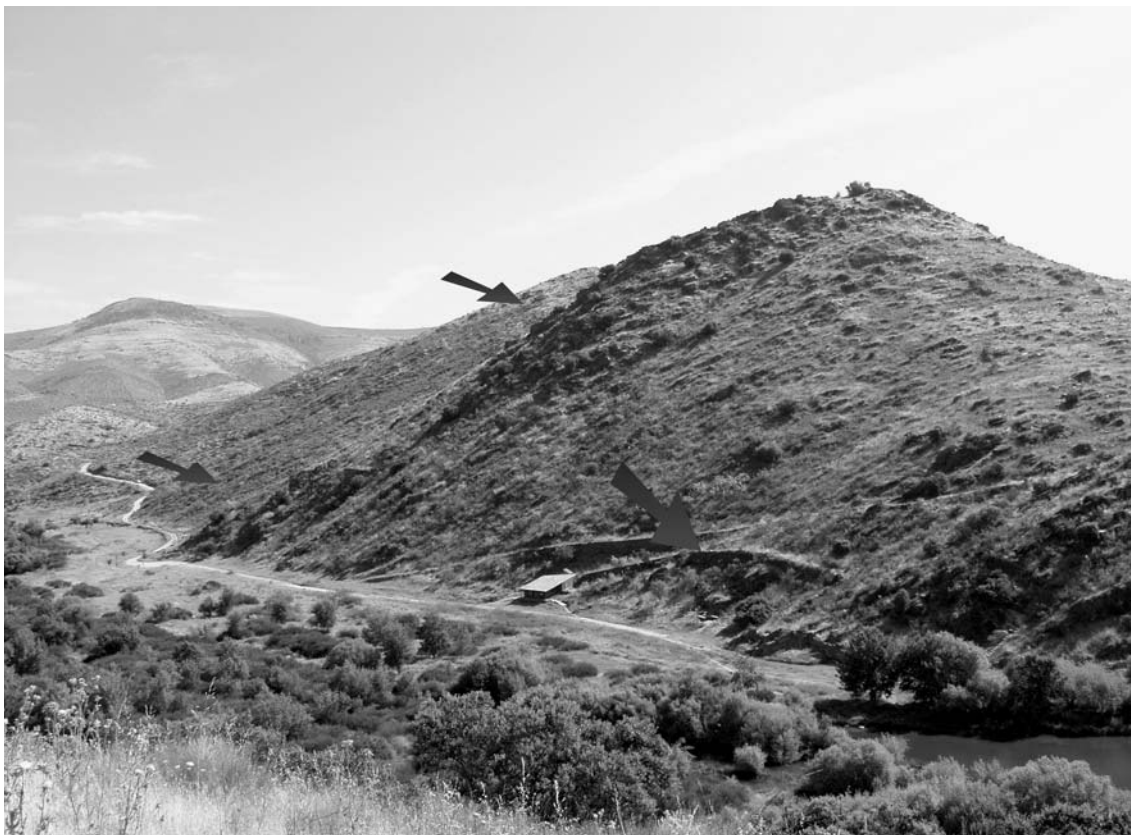
Fig. 5 Núcleo de Arte Rupestre da Penascosa. Encontram-se assinaladas as áreas onde se concentram a maioria dos painéis gravados deste Núcleo. (Fotografia Luís Luís).

telamento dos afloramentos fornecerá esse procurado equilíbrio. É pois fácil de imaginar o enorme esforço a que estão sujeitos os afloramentos e que em última análise origina grande parte das patologias que afectam, nas escalas micro e médio local, a estabilidade dos painéis. Falamos nomeadamente do toppling , um tipo de fracturação horizontal em que os fragmentos superiores vão avançando de forma progressiva e escalonada formando uma espécie de escadaria invertida (Rodrigues, 1999).