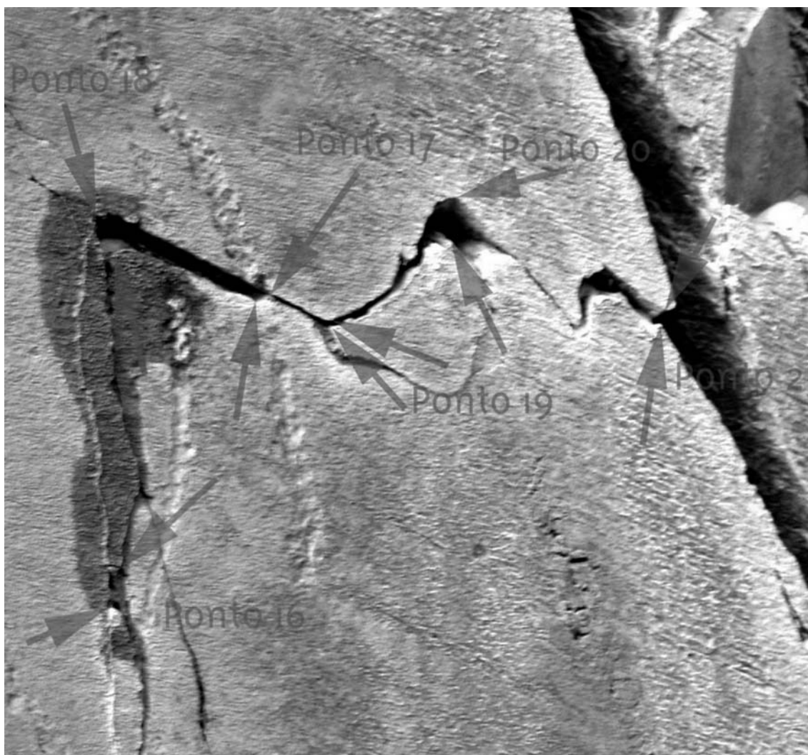
Fig. 7 Pormenor da cartografagem digital de pontos para medição dos movimentos de um painel gravado, neste caso a Rocha 1 da Ribeira de Piscos. De realçar que o original é de muito melhor qualidade, permitindo assim uma correcta referência. De referir que a zona mais sombria entre os pontos 18 e 16 corresponde a um corrimento natural de origem pluvial.

No ponto 7 discriminam-se ainda vários projectos distintos de monitorização de características específicas do meio ambiente tais como sejam o clima ou a sismicidade, fundamentais para uma completa compreensão de todo o contexto envolvente dos afloramentos.