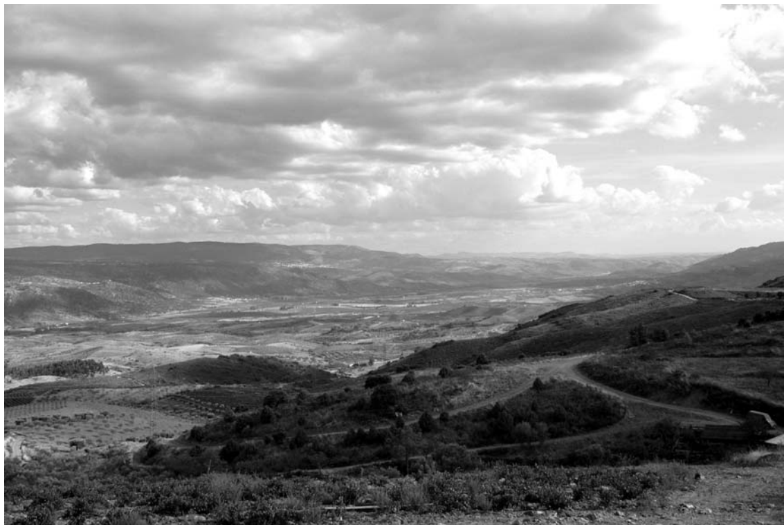
Fig. 3 Vista geral (orientação N-S) do início da Falha da Vilaríça-Longroiva, obtida junto da povoação da Trindade, concelho de Vila Flor. De notar quer a largura, quer a extensão desta Falha.

Entre as falhas tectónicas localizadas na região destaca-se pela sua extensão a falha de Vilaríça-Longroiva (ver Fig. 3). Esta falha “é um acidente complexo, com fracturação numa faixa de largura quilométrica” (Ribeiro, 2001, p. 6) e cuja actividade se prolonga até ao presente “a julgar pela deformação dos sedimentos relativamente recentes e pelos registos de sismicidade actual” (Ribeiro, 2001, p. 6). A existência na região desta falha em actividade constitui-se como um factor de risco latente, de todo não controlável, para a preservação da arte rupestre.