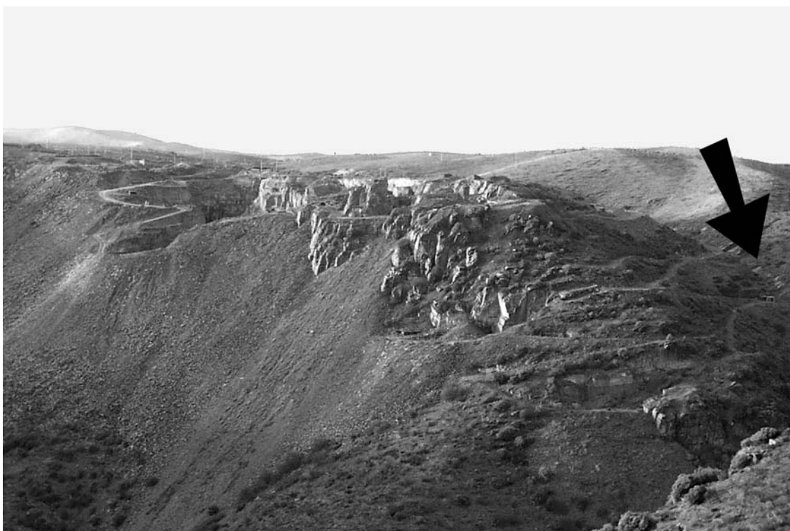
Fig. 2 Pedreiras do Poio. A seta indica a canada, vale estreito e declivoso, no fundo da qual se situam as superfícies gravadas da Canada do Inferno.