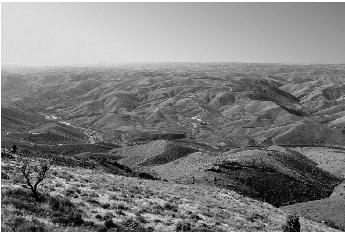
Fig. 1 O Vale do Côa com a Quinta da Ervamoira em fundo (fotografia António Martinho Baptista/CNART).