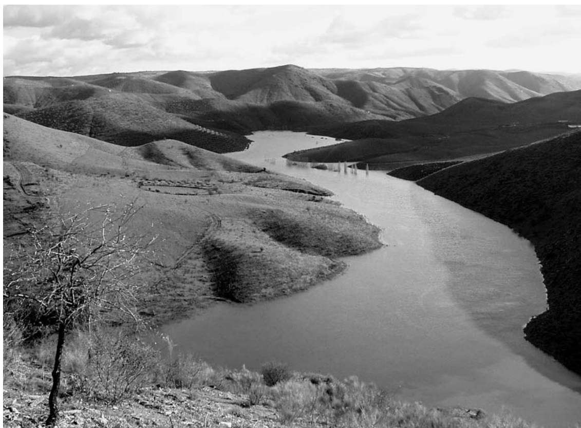
Fig. 8 Fotografia datada de 6 de Janeiro de 2003, obtida junto do Núcleo da Ribeira de Piscos, e que ilustra o pico máximo das cheias desse ano, quando o Rio extravasou o seu nível normal em cerca de 10 metros.

Certos painéis são por vezes também limpos. De facto, nos Núcleos da Canada do Inferno, da Penascosa e da Ribeira de Piscos, um reduzido número de painéis ficam cobertos pelos sedimentos arrastados e depositados pelo Côa, quando este, durante Invernos de grande pluviosidade, galga as margens e inunda os referidos Núcleos (ver Fig. 8). Após a descida do rio para o seu nível normal é necessário limpar a área dos Núcleos de resíduos e os painéis dos sedimentos lodosos depositados pelo rio e que impedem a completa percepção pelos visitantes dos motivos gravados nos painéis que temporariamente permaneceram debaixo de água. Assim desenvolvemos um método de limpeza não agressivo que consiste na utilização de água do rio — e somente água do rio — e duma vulgar esponja, feita do mesmo material utilizado na fabricação de colchões de espuma ou de esponjas de banho, a espuma flexível de poliuretano. Após se humedecer a esponja num balde